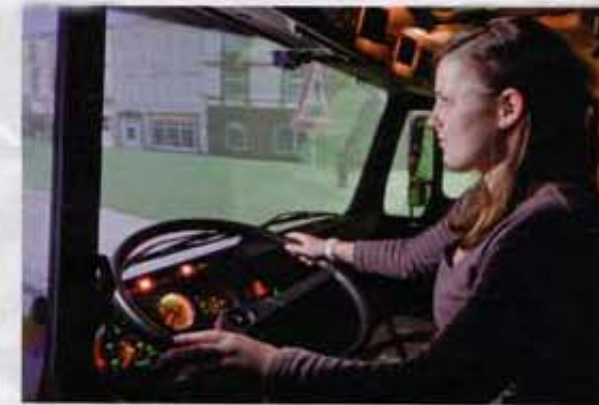
Erste Klasse im Fahrsimulator am Lehrstuhl für Informatik im Maschinenbau. Mit ihm werden Fahrerassistenzsysteme erprobt.

In der traditionell schon außerordentlich starken Forschung will die Aachener Elite-Universität ihr bis 2020 gestecktes Ziel unter anderem dadurch erreichen, dass sie die Kernkompetenzen erzieht